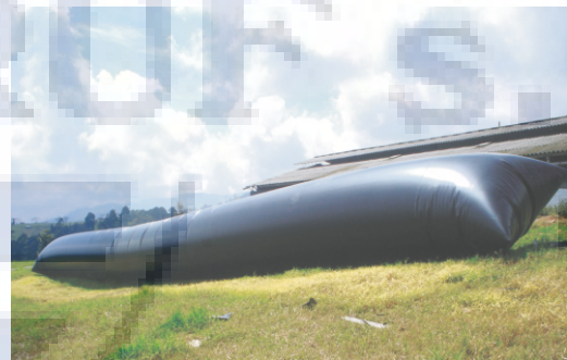
BIODIGESTORES DE 100M3

En la imagen que vemos a continuación hay dos Biodigestores de 100 m 3 Las fosas para instalar estos Biodigestores los podemos hacer en tierra firme no siempre es necesario hacerlos en concreto para introducir el Biodigestor