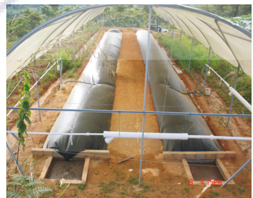
BIODIGESTORES DE 120M3 EN MEMBRANA PVC 600 MICRAS

Cuando tenemos exceso de gas este lo podemos almacenar en reservorios de gas (pulmones) fabricados en membranas de PVC de un espesor mínimo de 300 micras que se colocaran paralelamente a la campana de almacenamiento de gas del sistema encapado. Este procedimiento se realiza mediante una tubería de PVC que se conecta con los dos sistemas, o lo podemos fabricar para que sea instalado como lo muestra la imagen (el pulmón se encuentra instalado en medio de los dos Biodigestores).